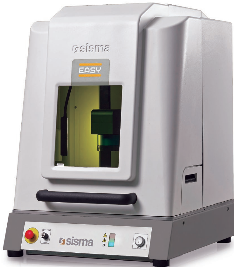
Laser marking system Sistema di marcatura laser